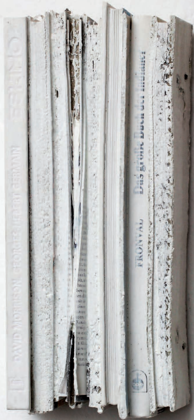
Das große Buch der Indianer 2006 | geschnittene Bücher, Acryl 31 x 14 x 8 cm