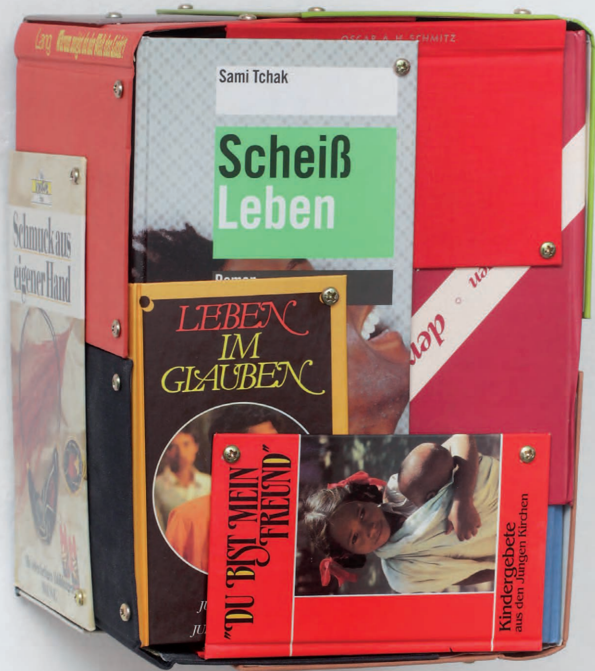
Im Auftrag des Königs | 2009 | Buchdeckel, Schrauben | 20 x 28 x 20 cm