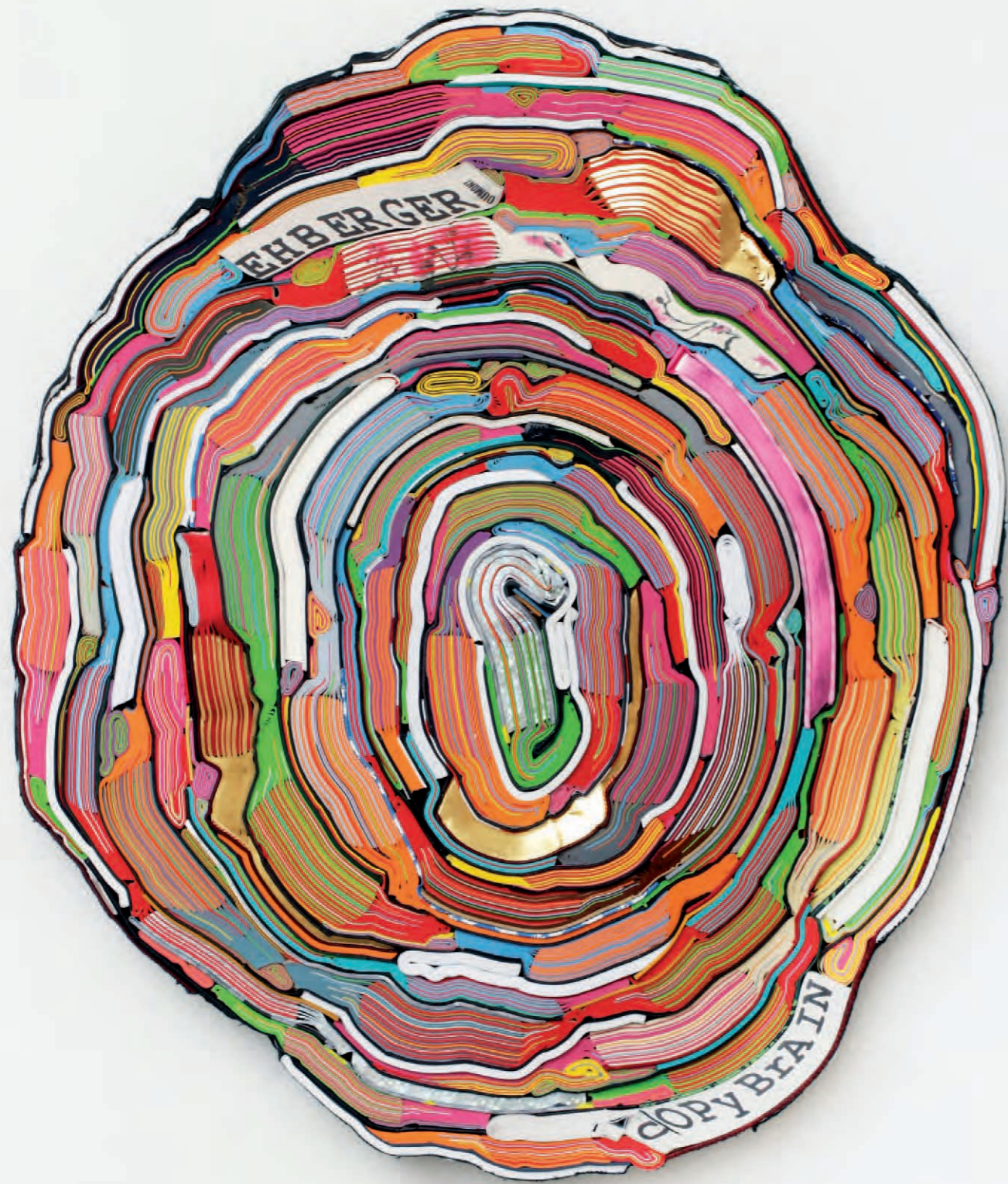
Tobias Rehberger – Copy brain 2014 | geschnittene Bücher, Textilien, Schrauben | Ø 60 x 6 cm