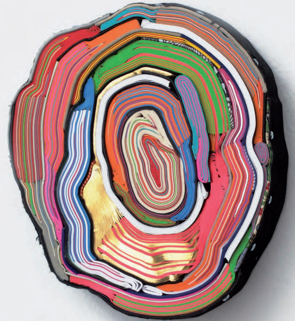
Gold Fever Edition (2) | 2014 geschnittene Bücher, Textilien, Schrauben | Ø 20 x 6 cm