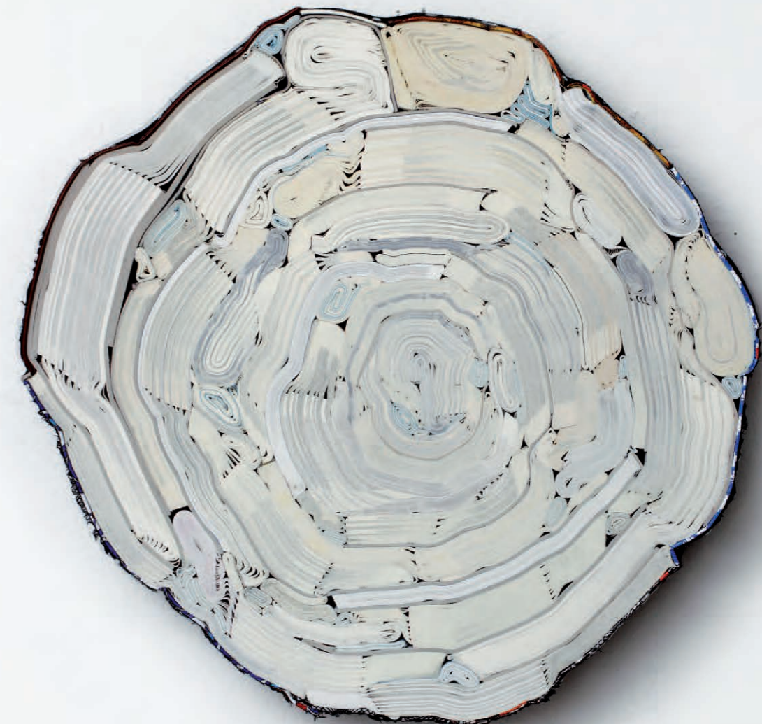
Lonely Planet | 2014 geschnittene Bücher, Textilien, Schrauben Ø 43 x 6 cm