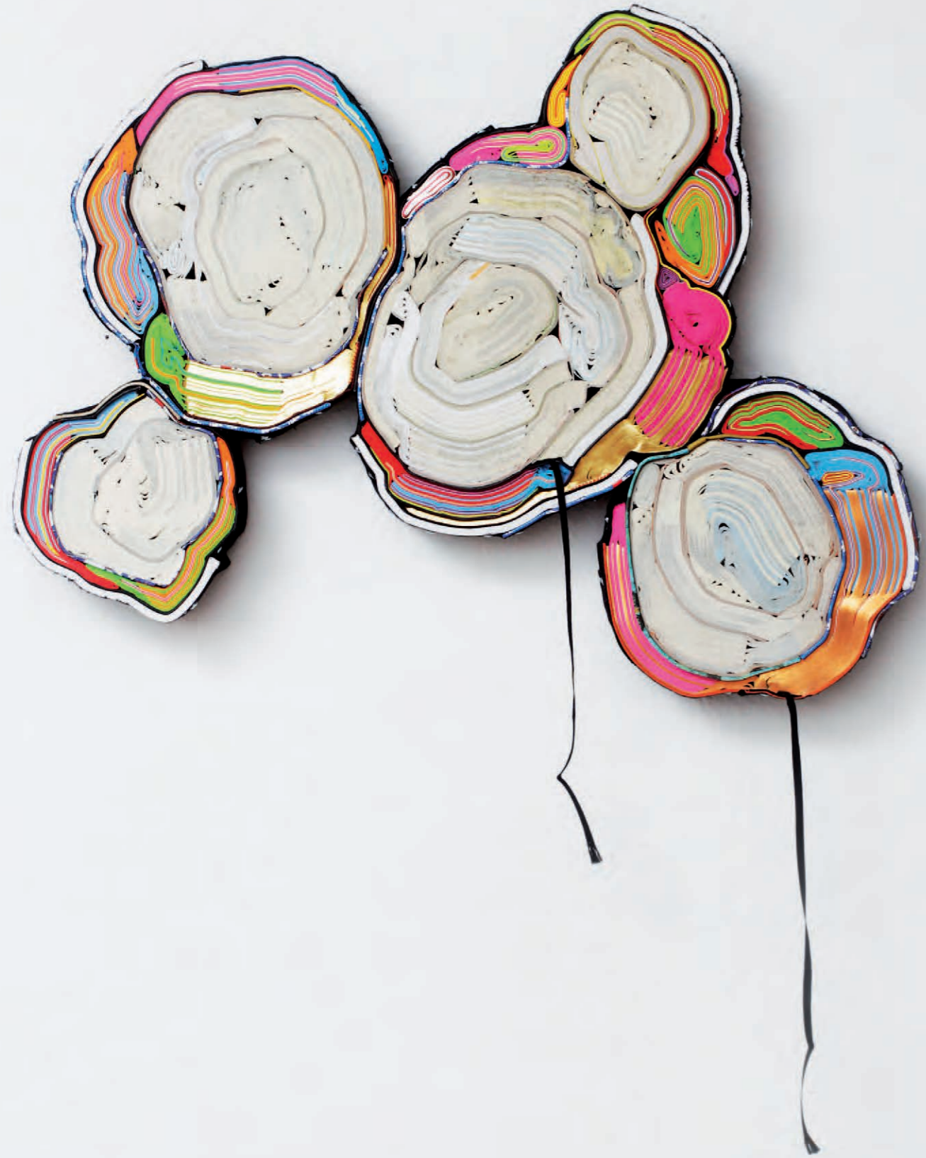
The White Puma | 2014 | geschnittene Bücher, Textilien, Schrauben | 55 x 50 x 6 cm