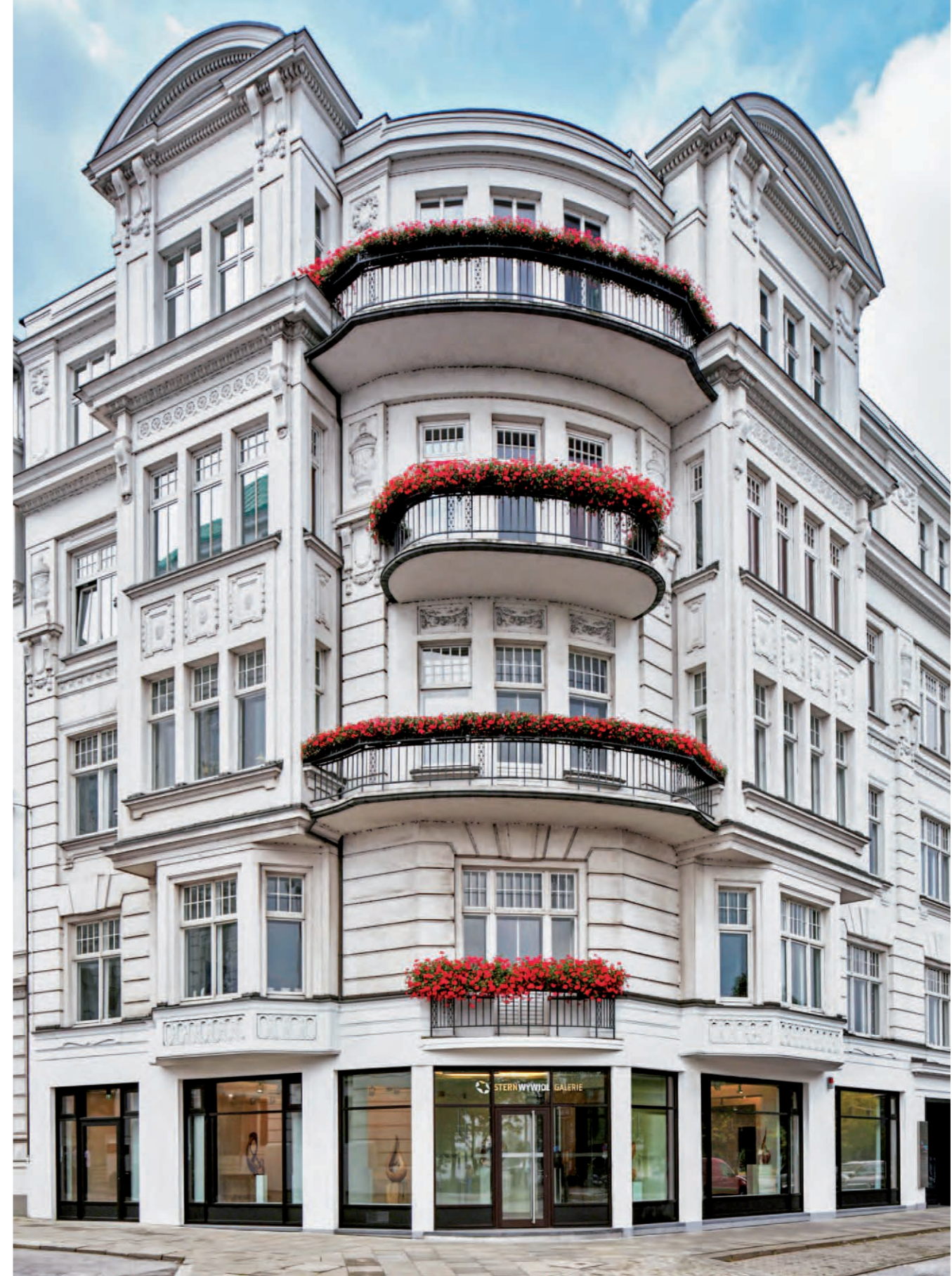
Die Stern-Wywiol Galerie in Hamburg: ein Ort für zeitgenössische Skulptur. Kunstberatung für Privat-, Business und öffentliche Räume.