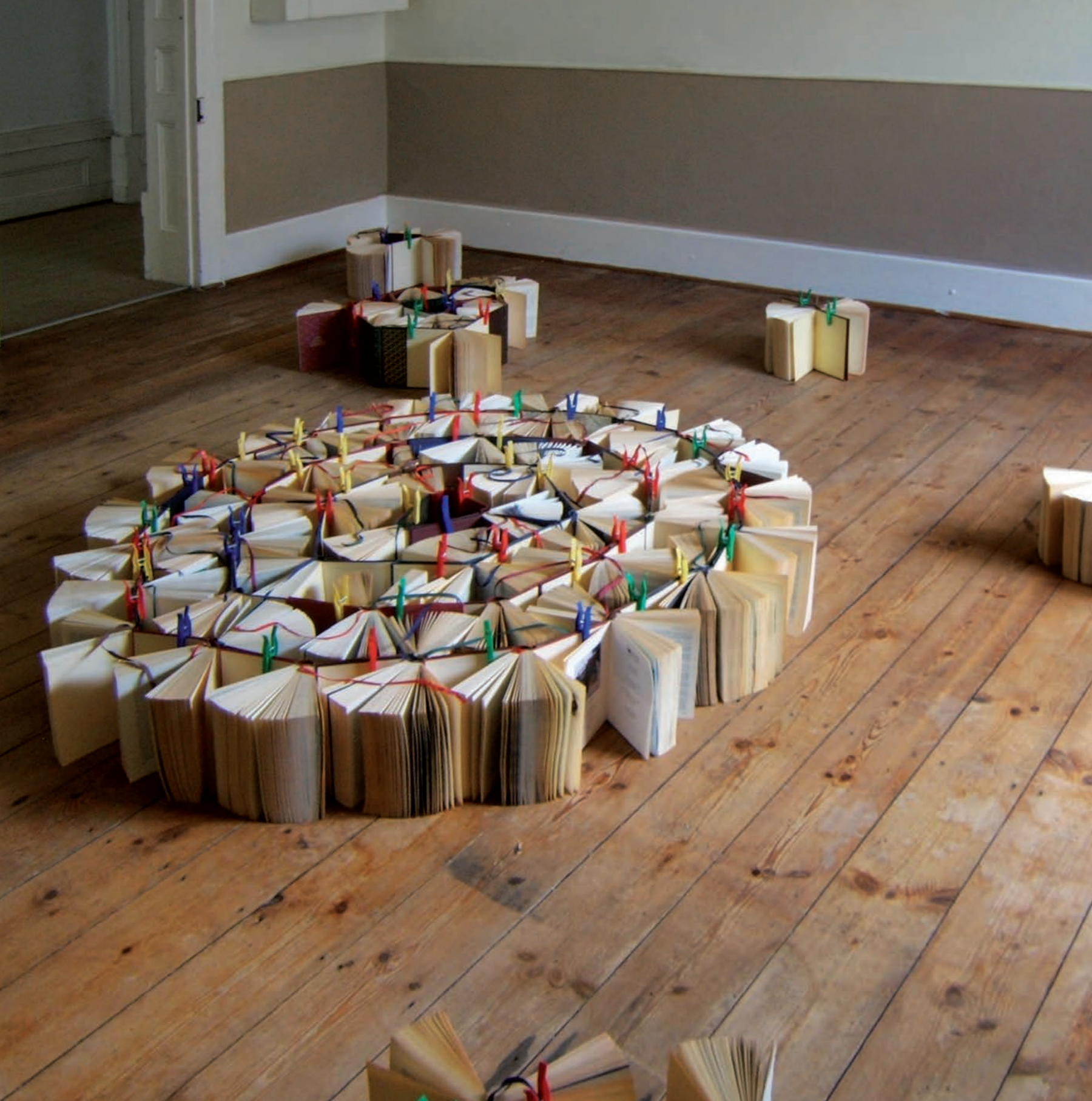
Blick auf die Buchinstallation in der Map Gallery, Richmond, Südafrika, Oktober 2014:

A maze is amazed, (that the maze), is amazing! | 2014 | Bücher, Klammern | Größe variabel