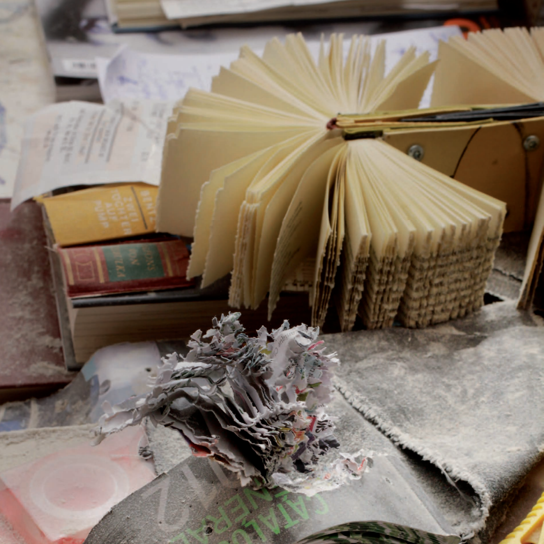
Creepy Crawlies 2011 | geschnittene Bücher, Schrauben je 25 x 15 x 6 cm