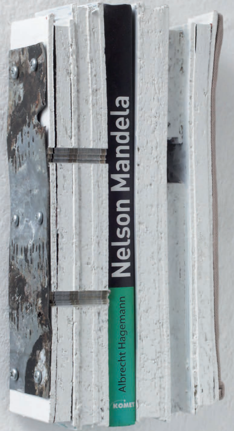
Nelson Mandela | 2007 geschnittene Bücher, Metall, Schrauben, Acryl, Textilien | 30 x 14 x 8 cm