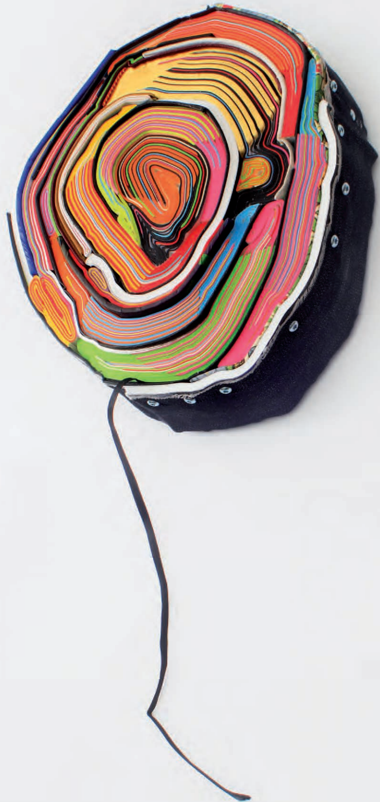
Gold Fever Edition | 2014 geschnittene Bücher, Textilien, Schrauben Ø 20 x 6 cm