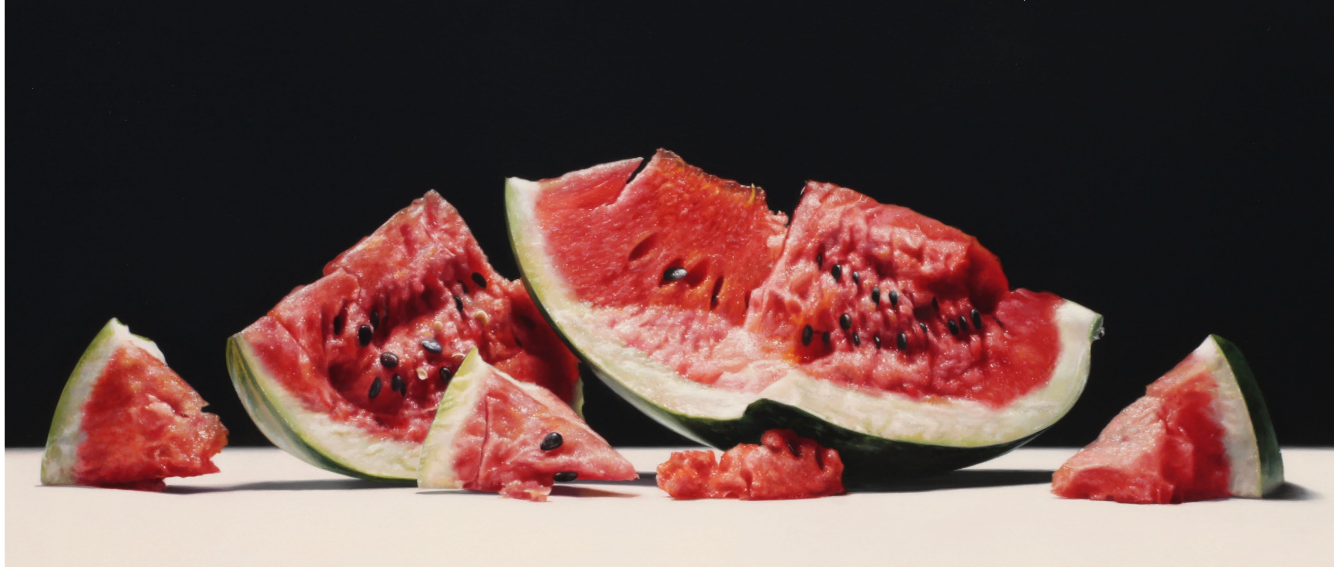
Wassermelone / Watermelon, 2021, Öl auf Malplatte / oil on canvas panel, 32 x 80 cm