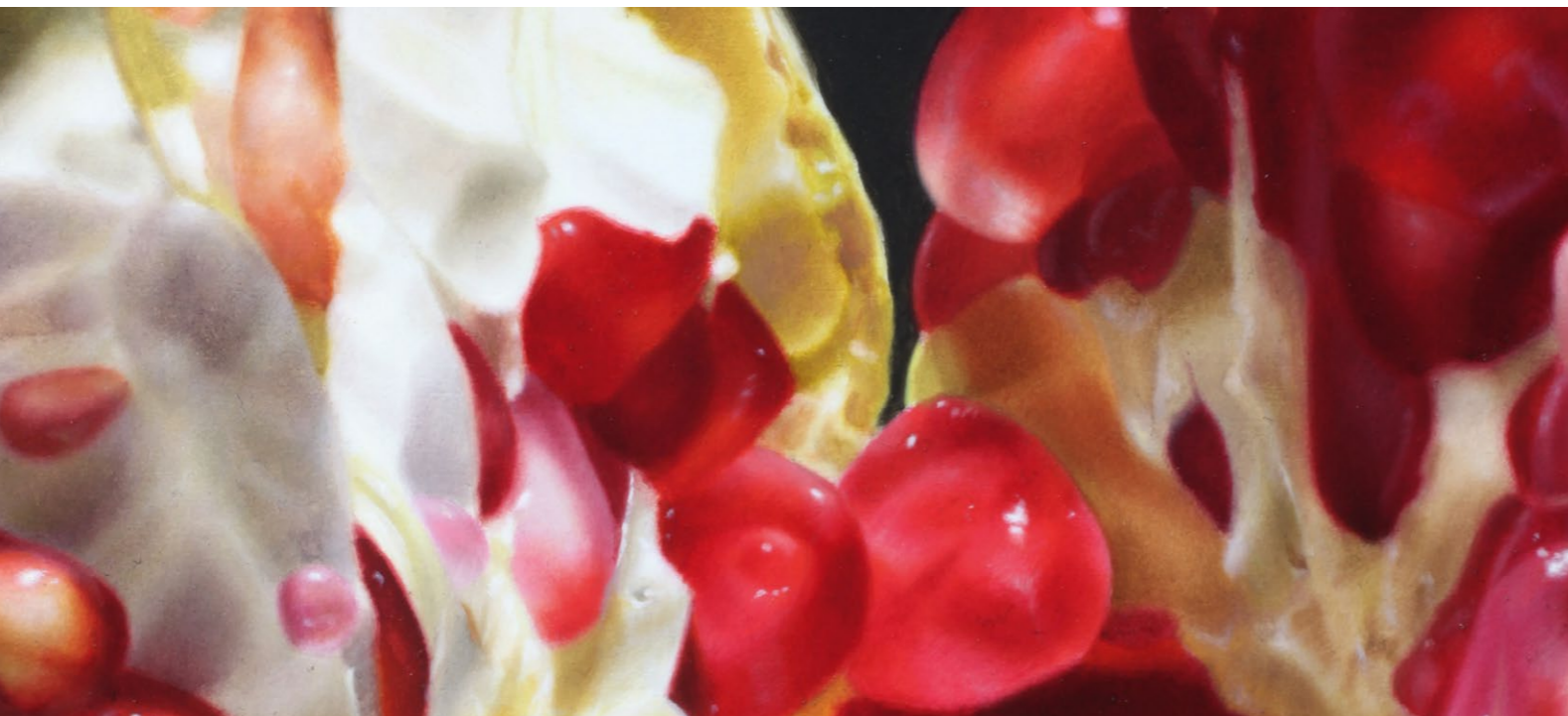
Granatapfel / Pomegranate, 2021, Öl auf Malplatte / oil on canvas panel, 50 x 60 cm

Rot / Red, 2021, Öl auf Malplatte / oil on canvas panel, 27,5 x 75 cm >