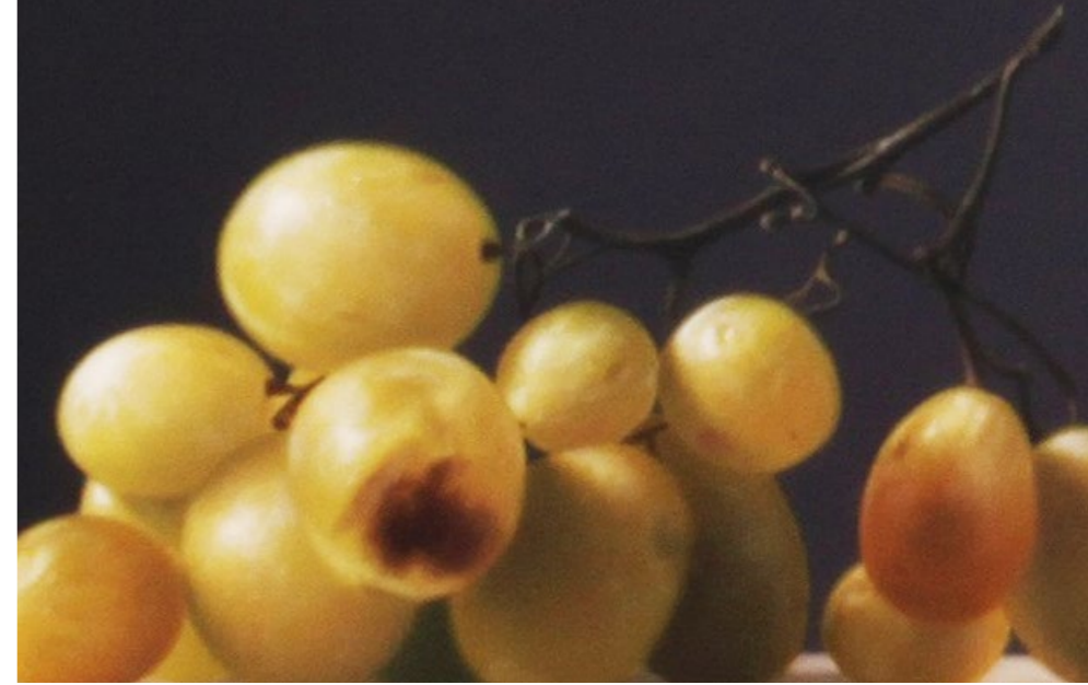
Krug mit Trauben / Jug with Grapes, 2020, Öl auf Malplatte / oil on canvas panel, 41 x 75 cm