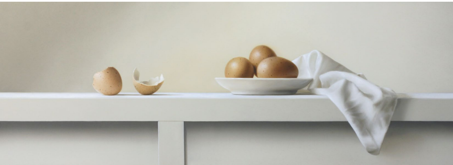
Eier / Eggs, 2021, Öl auf Malplatte / oil on canvas panel, 27,3 x 75 cm