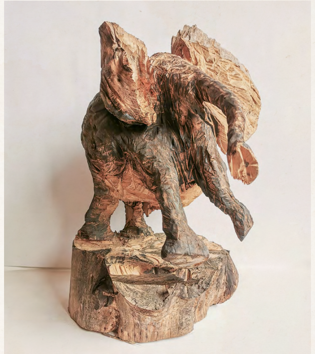
Thomas Putze stürmischer Elefant, 2020 Thuja, Acryl, Tusche 77 x 60 x 50 cm EUR 4.800