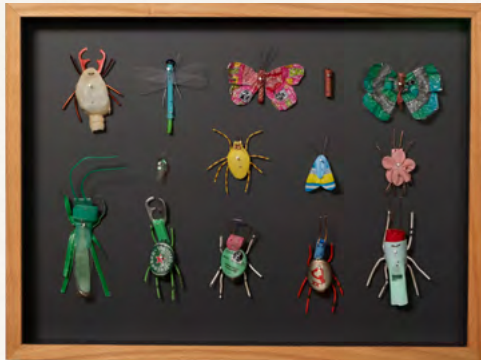
Matthias Garff Insektenkasten (Mexiko V), 2023 Fundstücke, Objektkasten 30 x 40 cm EUR 2.200