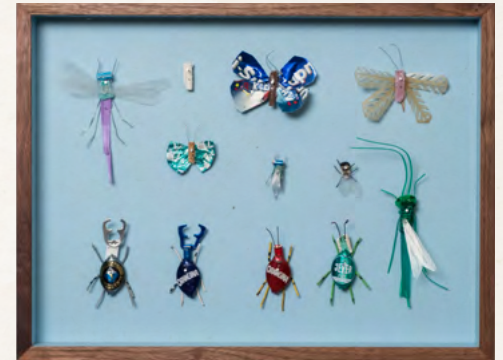
Matthias Garff Insektenkasten (Juli VII), 2023 Fundstücke, Objektkasten 30 x 40 cm EUR 2.200