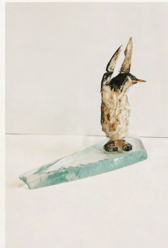
19. Thomas Putze Pinguin auf Eisscholle, 2024 Tanne, Tusche, Glas 20 x 24 x 9 cm EUR 500