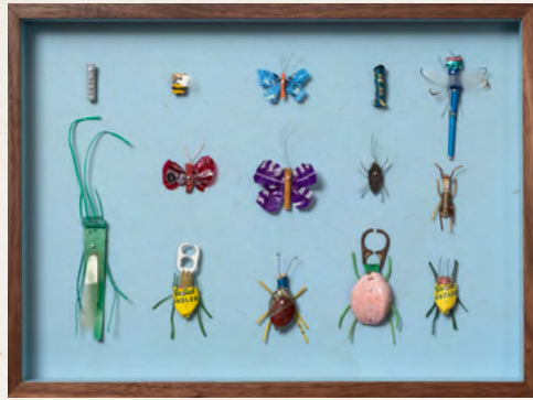
Matthias Garff Insektenkasten (August IV), 2023 Fundstücke, Objektkasten 30 x 40 cm EUR 2.200