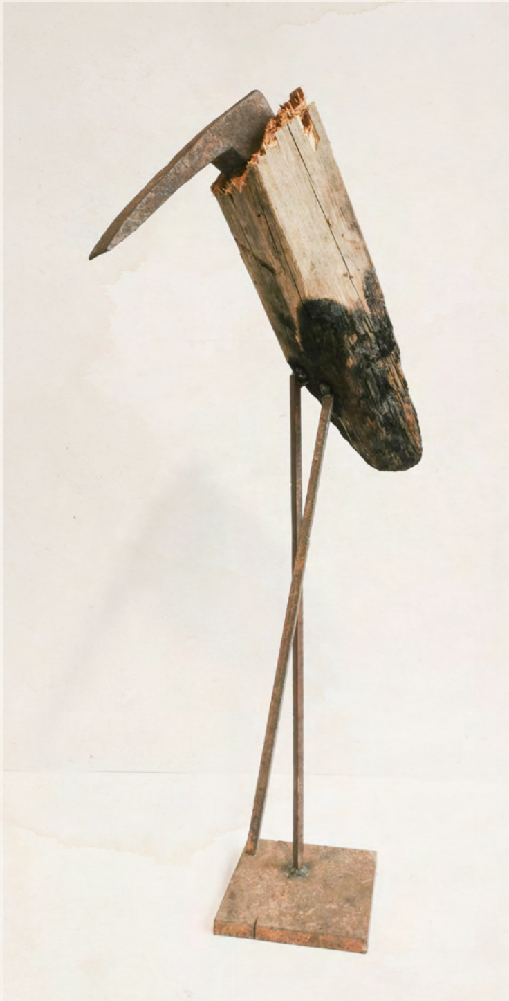
23. Thomas Putze Marabu, 2019 Fichte, Metall 105 x 50 x 25 cm EUR 4.800