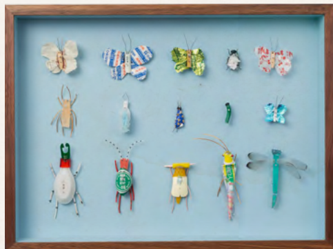
Matthias Garff Insektenkasten (Taiwan VIII), 2024 Fundstücke, Objektkasten 30 x 40 cm EUR 2.200