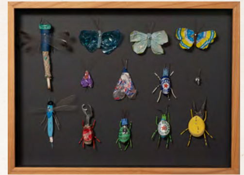
Matthias Garff Insektenkasten (Mexiko IX), 2023 Fundstücke, Objektkasten 30 x 40 cm EUR 2.200