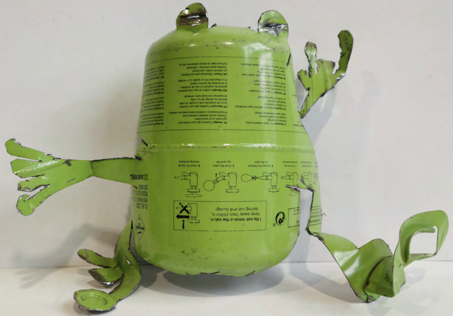
02. Thomas Putze Laubfrosch, 2023 Blech, Lack 30 x 44 x 20 cm EUR 850