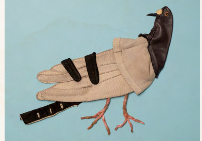
03. Matthias Garff Stadttaube IV, 2023 Lederhandschuhe, Pistazienschale, Schere, Schnur, Objektrahmen 28 x 30 cm EUR 1.400