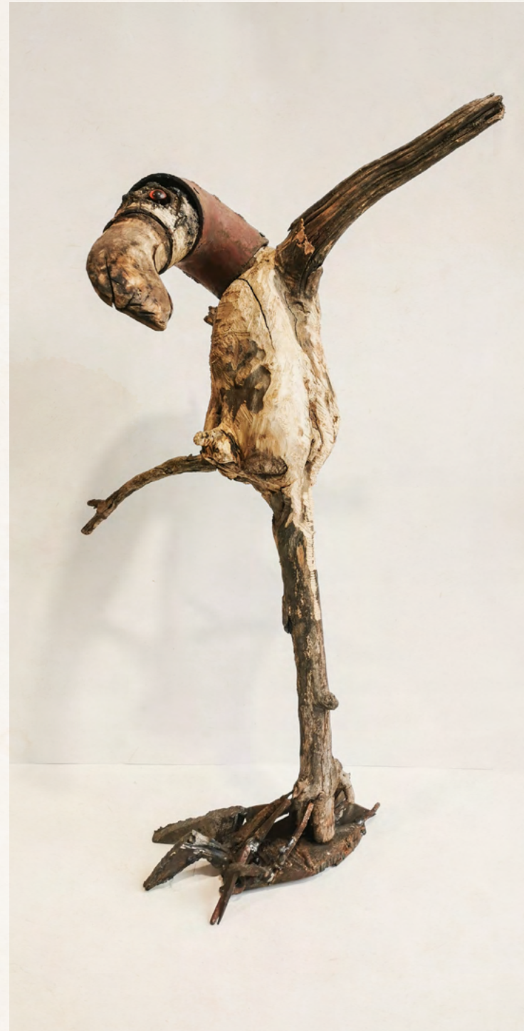
24. Thomas Putze Dronte (Dodo), 2020 Ahorn, Metall, Birke 105 x 50 x 25 cm EUR 4.800