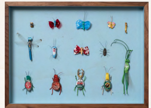
Matthias Garff Insektenkasten (August I), 2023 Fundstücke, Objektkasten 30 x 40 cm EUR 2.200