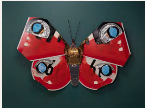
Tagpfauenauge (Beispielbild), 2023 Verkehrsschilder, Skateboard, Dose, Tischtennisschläger, Masken, Blech, Objektkasten, Museumsglas 105 x 140 x 13 cm EUR 10.000