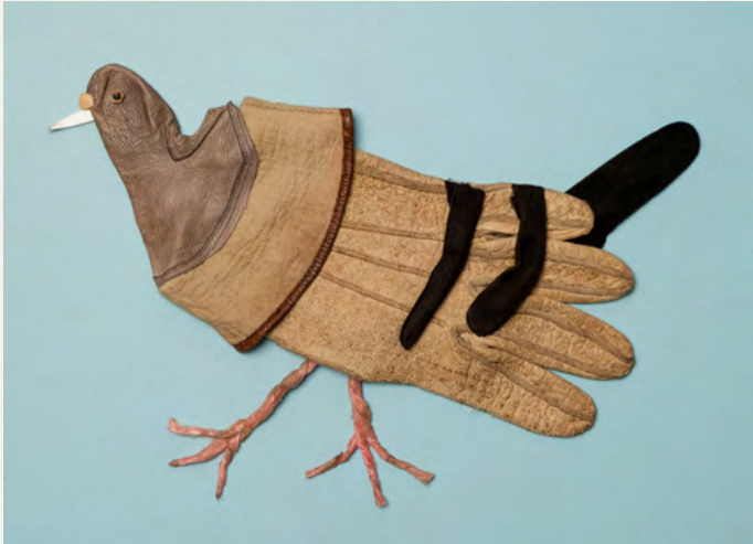
02. Matthias Garff Stadttaube III, 2023 Lederhandschuhe, Pistazienschale, Schere, Schnur, Objektrahmen 27 x 30 cm EUR 1.400