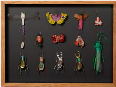
Matthias Garff Insektenkasten (Mexiko III), 2023 Fundstücke, Objektkasten 30 x 40 cm EUR 2.200