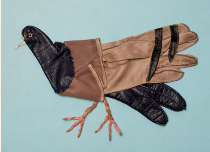
01. Matthias Garff Stadttaube I, 2023 Lederhandschuhe, Pistazienschale, Schere, Schnur, Objektrahmen 25 x 30 cm EUR 1.400