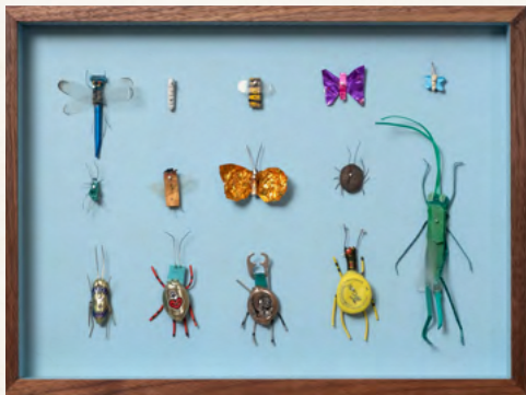
Matthias Garff Insektenkasten (August VI), 2023 Fundstücke, Objektkasten 30 x 40 cm EUR 2.200